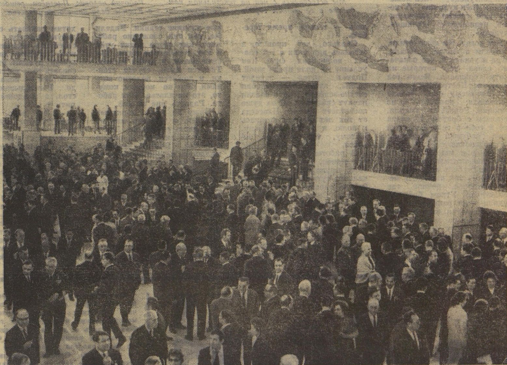
НА СНИМКЕ: в Кремлёвском Дворце съездов во время перерыва.

Посылаем пламенный пионерский привет, желаем плодотворной работы.